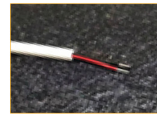
Cable de 2 vías (1m)