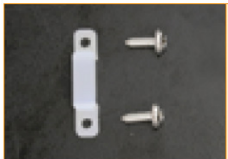
Clip de montaje (set de 10 pzas)