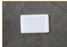
Tapa para sellado (1 pza)