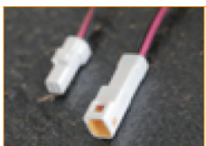
Conector M/F IP67 (1pza)