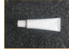
Pegamento para sellado (1pza)