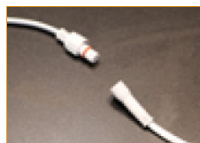
Conector M/F IP65 (1pza)