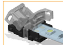
Coloque la tira LED directamente en el conector.