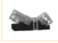
Conector IP65 Tira a cable (1 pza)