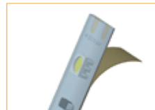
Despegue la cinta 3M de la tira LED.