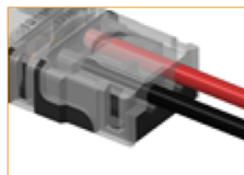
Cierre el conector hasta que la cubierta quede bloqueada.