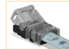
Cierre el conector hasta que la cubierta quede bloqueada.