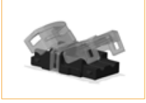
Conector IP65 Tira a tira (1 pza)