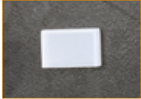
Tapa final para sellado (1 pza)