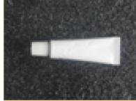
Pegamento para sellado (1 pza)