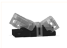
Conector IP65 Tira a cable