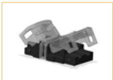
Conector IP65 Tira a tira