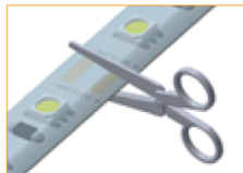
Corta la tira LED en los puntos de corte indicados.