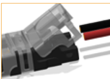
Coloque el cable requerido en el conector.